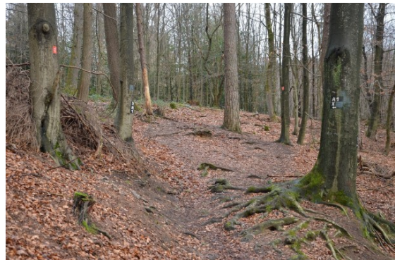
Naturbelassene Pfade auf dem Bensberger Schlossweg

11:30 h wir fahren von Köln-Kalk zur Haltestelle Bensberg 12:30 h wir wandern den Bensberger Schlossweg unterwegs Pause im Naturfreundehaus Hardt 16:30 h Ausklang in einem Restaurant in Bensberg